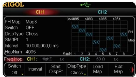
用户可编辑跳频图案